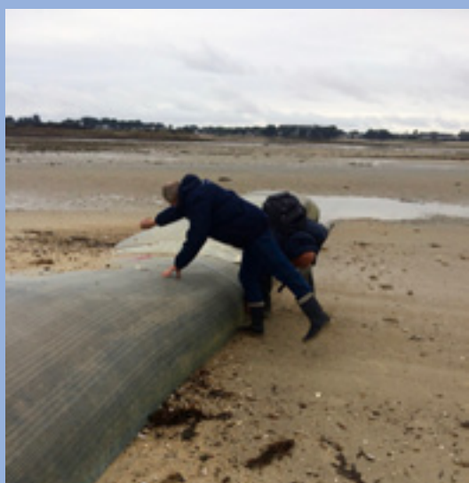
Mesures sur stabiplage