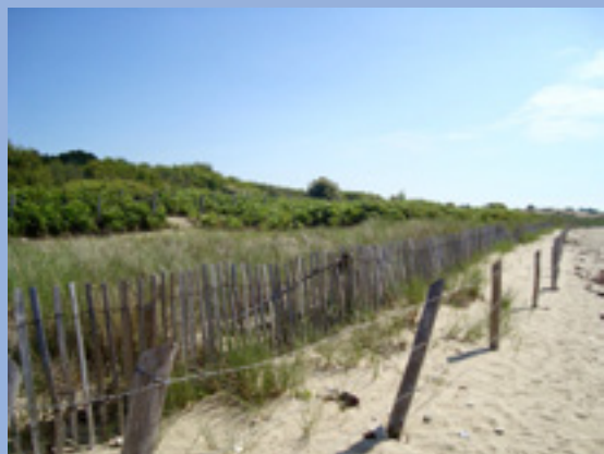
Tri-fils et ganivelles