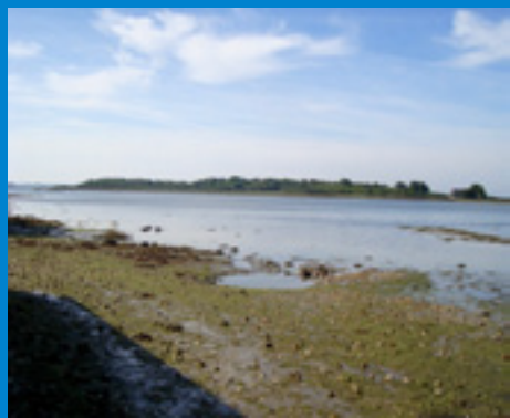
L'Ile de Boëde