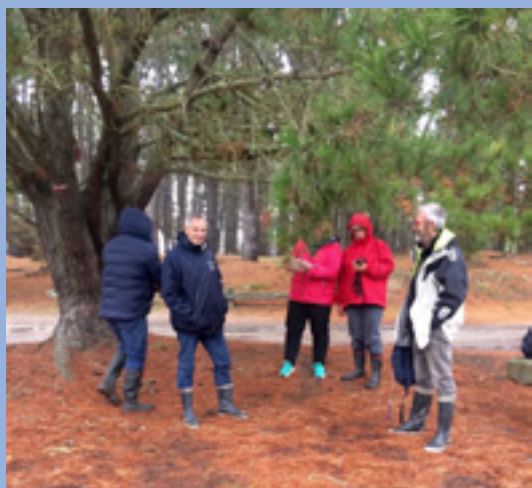
Equipe de Kervillen