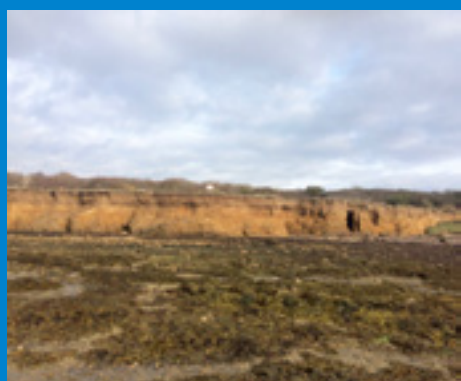
Falaise orientée sud