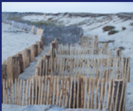
Casiers de Ganivelles