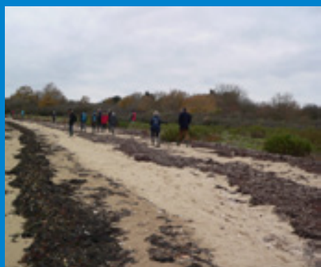
Reconnaissance de terrain