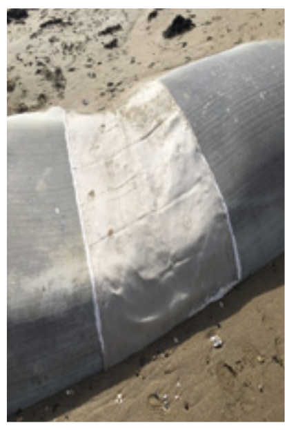
Stabiplate n° 1

Une fois de plus, nous déplorons les dégradations volontaires survenues sur les stabiplates, de plus certaines réglettes ont été dérobées....! Le CD56 a du une fois de plus convoqué le service pour une maintenance a effectuer, nous espérons que la citoyenneté l' emportera....!!!