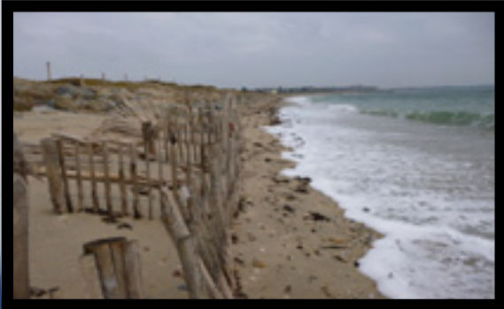
Ganivelle en souffrance après les tempêtes de cet hiver