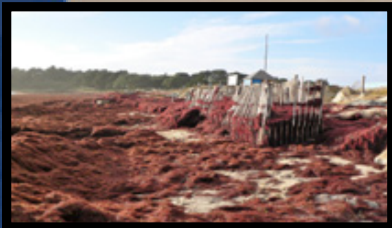
Echouage important d'algues rouges le 11 novembre dernier

Plusieurs dégradations naturelles constatées sur la plage du Fogeo ! les dernières tempêtes hivernales ont été intenses et, certains box se sont déchaussés avec les intempéries et l'échouage massif d'algues le 11 novembre dernier, une maintenance sera effectuée au printemps, phénomènes météorologiques classiques (pluie, vent, tempêtes, houle)