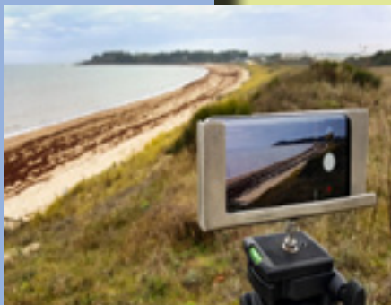
Coastnap, deux installations sur Gâvres

Nous vous tiendrons informés des étapes de cette nouvelle zone d'observations